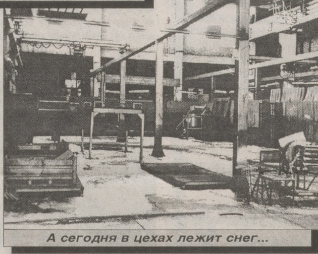
А сегодня в цехах лежит снег...

вспомянув о том, как "Гатчинсельмаш" вставал из руин после освобождения Гатчины от немецко-фашистских захватчиков. Тогда, в феврале 1984-го, "Гатчинсельмаш" отмечал свой 50-летний юбилей и был на подъеме, выпуская 10 тысяч протравливателей семян (ПС-10) в год, а кроме того, - тысячи камнеуборочных машин, дождевальными аппаратами, рукавов высокого давления и другой продукции. В 1978 году ПС-10 (по этим машинам "Гатчинсельмаш" являлся монополистом) был удостоен государственного Знака качества, чего в то время было очень сложно достичь. Предприятие регулярно занимало так называемые классные места в Минис-