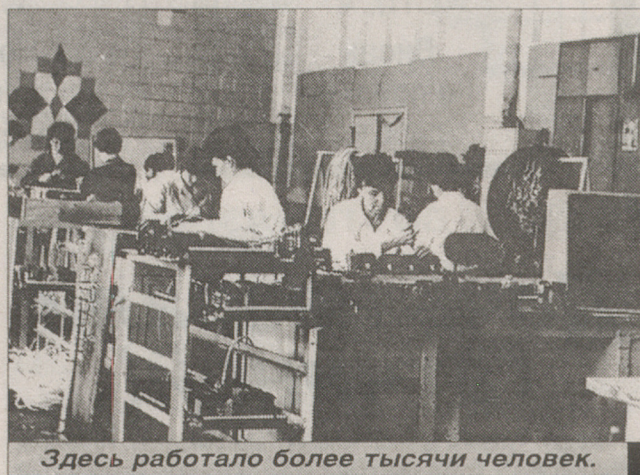
Здесь работало более тысячи человек.

вспомянув о том, как "Гатчинсельмаш" вставал из руин после освобождения Гатчины от немецко-фашистских захватчиков. Тогда, в феврале 1984-го, "Гатчинсельмаш" отмечал свой 50-летний юбилей и был на подъеме, выпуская 10 тысяч протравливателей семян (ПС-10) в год, а кроме того, - тысячи камнеуборочных машин, дождевальными аппаратами, рукавов высокого давления и другой продукции. В 1978 году ПС-10 (по этим машинам "Гатчинсельмаш" являлся монополистом) был удостоен государственного Знака качества, чего в то время было очень сложно достичь. Предприятие регулярно занимало так называемые классные места в Минис-